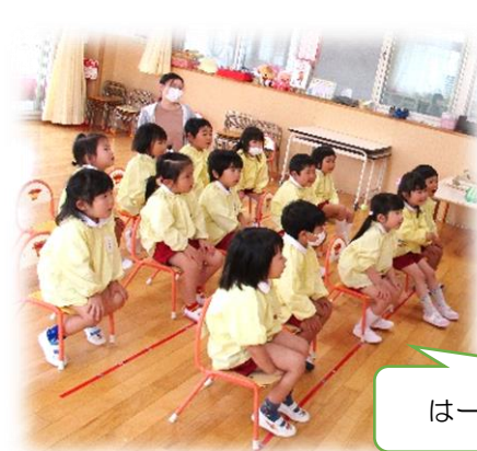
おーい。元気かーい？